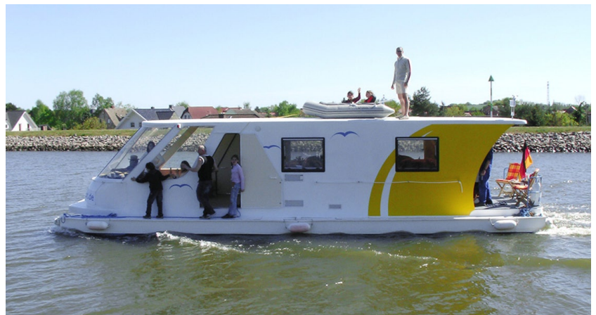
Pontonhausboot SEADES 39

Die Partner des Netzwerkes INNOBOOT sind mit einem völlig neuen Konzept in diesen Markt vorgestoßen und bieten Bootsverleihern, Charterfirmen und Privatpersonen seit Mitte 2007 als erstes kommerzielles Produkt das Hausboot SEADES 39 in Ponton-Bauweise zum Preis eines Mittelklassewagens an. Die Motorisierung erfolgt zunächst mit einem Benzin-Außenbordmotor, der gekapselt und nicht sichtbar unter dem Doppelbett angebracht ist. Geplant ist die spätere Umstellung auf ein Hybridsystem. Die Steuerung des Bootes erfolgt mit einem drehbaren Elektroantrieb am Bug sowie mit einer herkömmlichen Hydrauliksteuerung, die ein Ruder in Längsachse am Heck bewegt. Das erhöht die Stabilität bei Wind und Strömung und verbessert das Handling durch den Bootsführer deutlich.