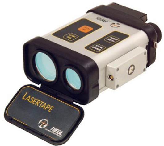
Entfernungsmessgerät „Laser-Rangefinder“ FG21-HA