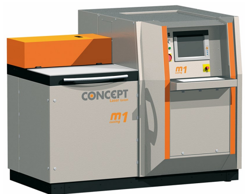
LaserCusing-Gerät „M1 cusing“

Concept Laser übernahm die Maschinen- und Materialentwicklung. Das ZZMK begleitete die Maschinen- und Materialentwicklung aus zahnmedizinischer Sicht und schuf die Grundlagen zur Einbindung des neuen Fertigungsverfahrens in die bestehende dentale CAD/CAM-Kette.