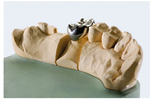
Mit LaserCusing hergestellter Zahnersatz